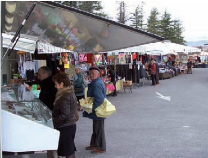
Un momento del mercato

Da fine luglio avremo un significativo aumento del numero di bancarelle che ogni giovedì si posano presso il Santuario per il mercato settimanale: l'incremento è stato deciso a seguito del buon successo riscontrato nei primi mesi e consentirà di arricchire di prodotti l'offerta mercatale di alimentari e di non alimentari.