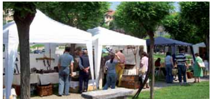
Un momento della manifestazione 2008

ne si è arricchita, proponendo nella prima giornata la rassegna di minipony, piccoli animali e prodotti gastronomici, che ha affiancato l'ormai tradizionale esposizione di prodotti artigianali e di antiquariato, delle due domeniche successive.