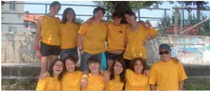
Il gruppo giovani impegnato in Estate Ragazzi 2008

Vogliamo presentare il gruppo di giovani che animano Estate Ragazzi. Sono 14, dai 13 ai 18 anni. Giovani, entusiasti, decisamente in gamba. Buona parte si è incontrata da ottobre a maggio nei locali dell'oratorio di Fiamenga per discutere gli argomenti più svariati, per scrivere il giornalino distribuito poi per tutta Vicoforte e tutti insieme si sono preparati, con un'esperta della coop. Caracol di Mondovì, ad animare Estate Ragazzi. Per mesi hanno coordinato l'attività dell'oratorio domenicale, animato con i canti la S.