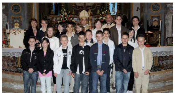
I ragazzi della cresima