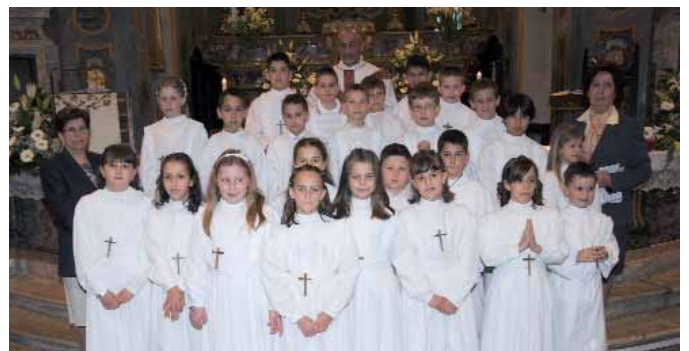
I ragazzi della prima comunione

Tutto è andato per il meglio e questa bella giornata ha ricordato che anche i momenti di svago e di allegria aiutano a crescere nell'amicizia e nella convivenza. Perciò a tutti un entusiastico...ARRIVEDERCI AL PROSSIMO ANNO! da parte degli educatori e accompagnatori.