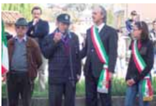
Un momento della commemorazione