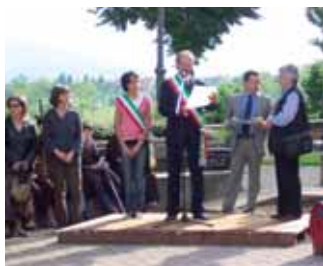
La consegna del riconoscimento

Domenica 1° giugno si sono svolti i festeggiamenti del nostro Santo Patrono, San Teobaldo, organizzati con la collaborazione delle Parrocchie e della Pro-Vicoforte; dopo la cerimonia religiosa, è stata effettuata la tradizionale offerta del vino alle Parrocchie Vicesi ed al Rettorato del