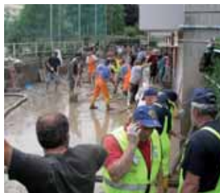
volontari della Protezione civile

E' stato impegnato durante l'ultima alluvione