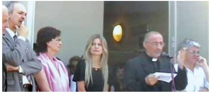
Un momento della cerimonia di inaugurazione

dopo il completamento dei lavori di ristrutturazione