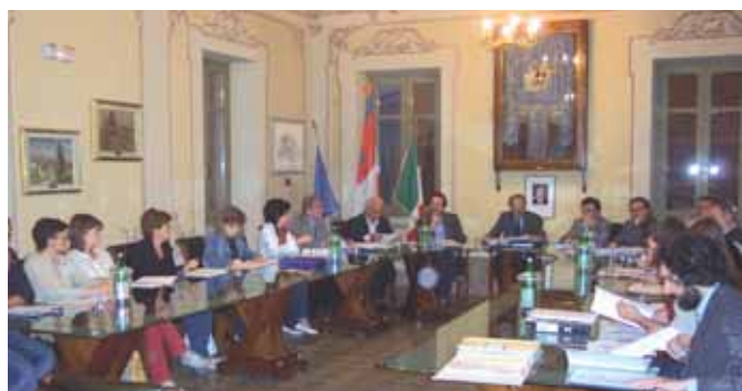
Un momento del consiglio