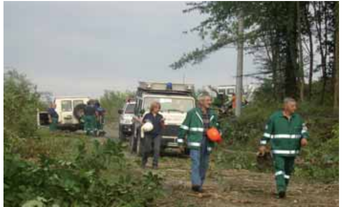
un momento dell'esercitazione Valli Monregalesi svoltesi nel 2006

Anche per il corrente anno l'attività del Gruppo risulta essere impegnativa e si prevedono molteplici interventi: nel mese di marzo il Gruppo ha partecipato a Mondovì alla pulizia del fiume Ellero e ad aprile nel Comune di Dogliani, all'esercitazione denominata "Langa Pulita". Si prevede inoltre che il Gruppo sarà di supporto per l'Adunata Nazionale degli Alpini che si svolgerà a Cuneo, con varie manifestazioni organizzate anche a Mondovì e nel nostro Comune. Sono inoltre già previsti vari eventi, lungo tutto l'anno, che si terranno a Vicoforte e che necessiteranno dell'intervento dei volontari. Inoltre sin da ora è noto che anche la nostra Protezione Civile var-