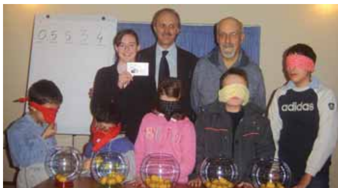
un momento dell'estrazione con la vincitrice del biglietto

Il 5 gennaio scorso l'estrazione davanti a un folto pubblico